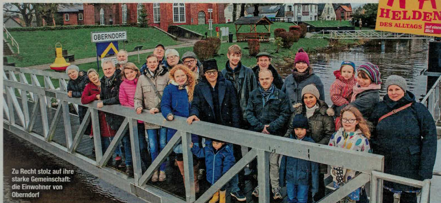
Zu Recht stolz auf ihre starke Gemeinschaft: Die Einwohner von Oberndorf